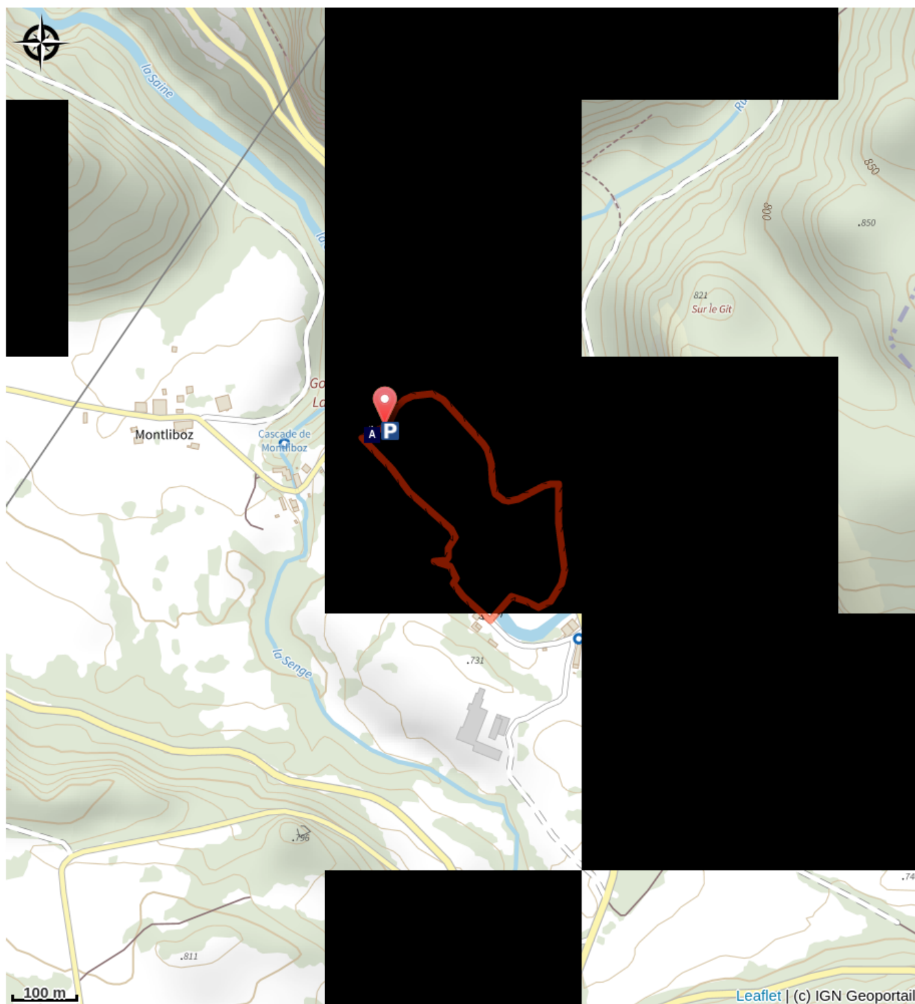
Les gorges de la Langouette (A)