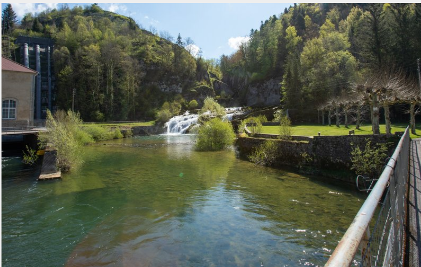
Pertes de l'Ain (Loïc Aubert)