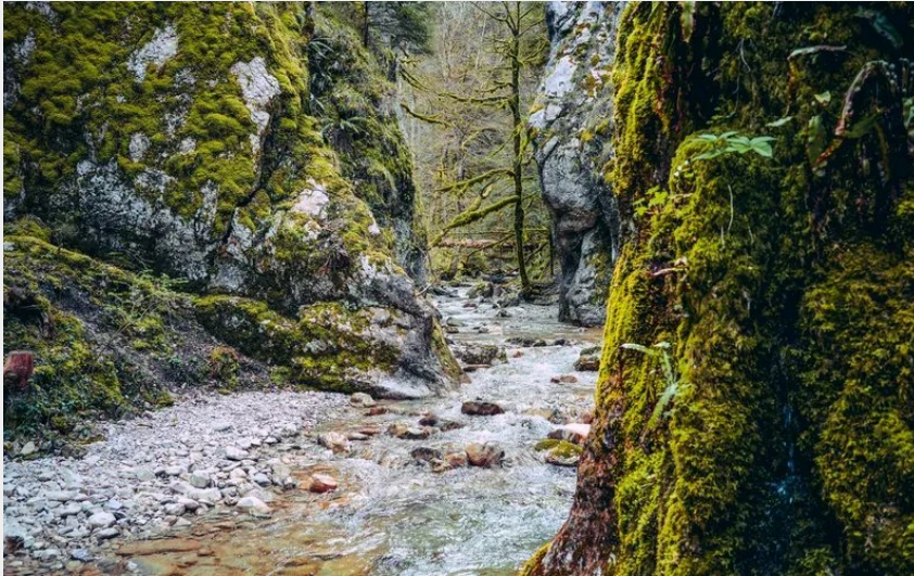
Les portes des sarrazines (Thomas Baillard)